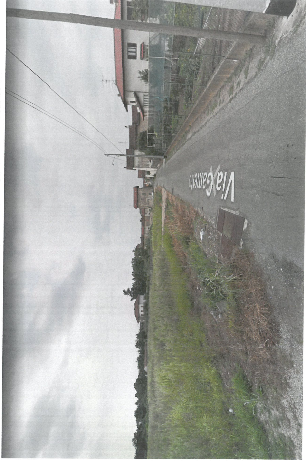
Ripresa fotografica dal lato nord

Riprese fotografiche antecedenti all'ampliamento della carreggiata stradale di via Gametto